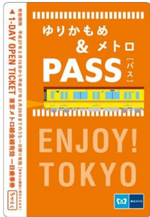
东京 Metro 地铁一日车票