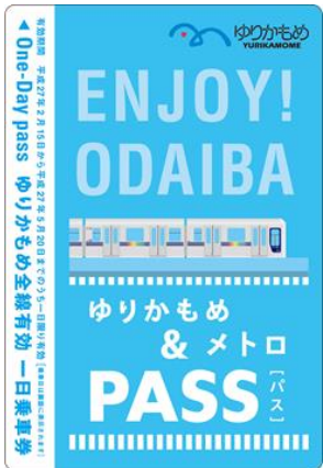
百合海鸥线一日车票