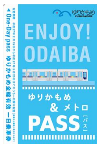
百合海鸥线一日车票