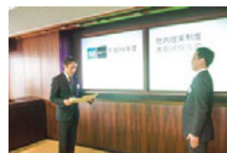
社内提案制度表彰

特に優れた提案に対して表彰を行っており、2014年度は、部長賞5件、特別賞11件を授与しました。