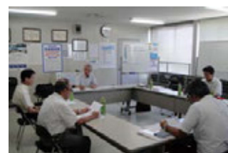
チームメトロミーティングの様子

課題などについて、社員と活発なディスカッションを行っています。2014年度は112回実施しました。