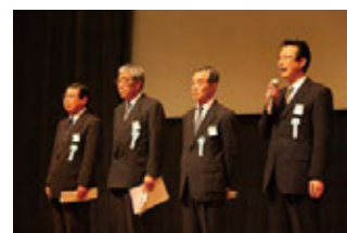
企業価値向上活動表彰

向上発表会」「業務改善・収益性向上発表会」にて合計36件の発表があり、審査の上、表彰されました。