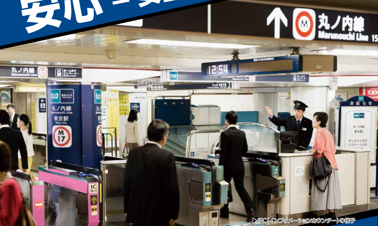
▶IFC(インフォメーションカウンター)の様子