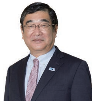
常務取締役鉄道本部長 安全統括管理者

これらの施策を着実に推進し、全てのお客様に「安心」をお届けできる地下鉄を作り上げてまいります。