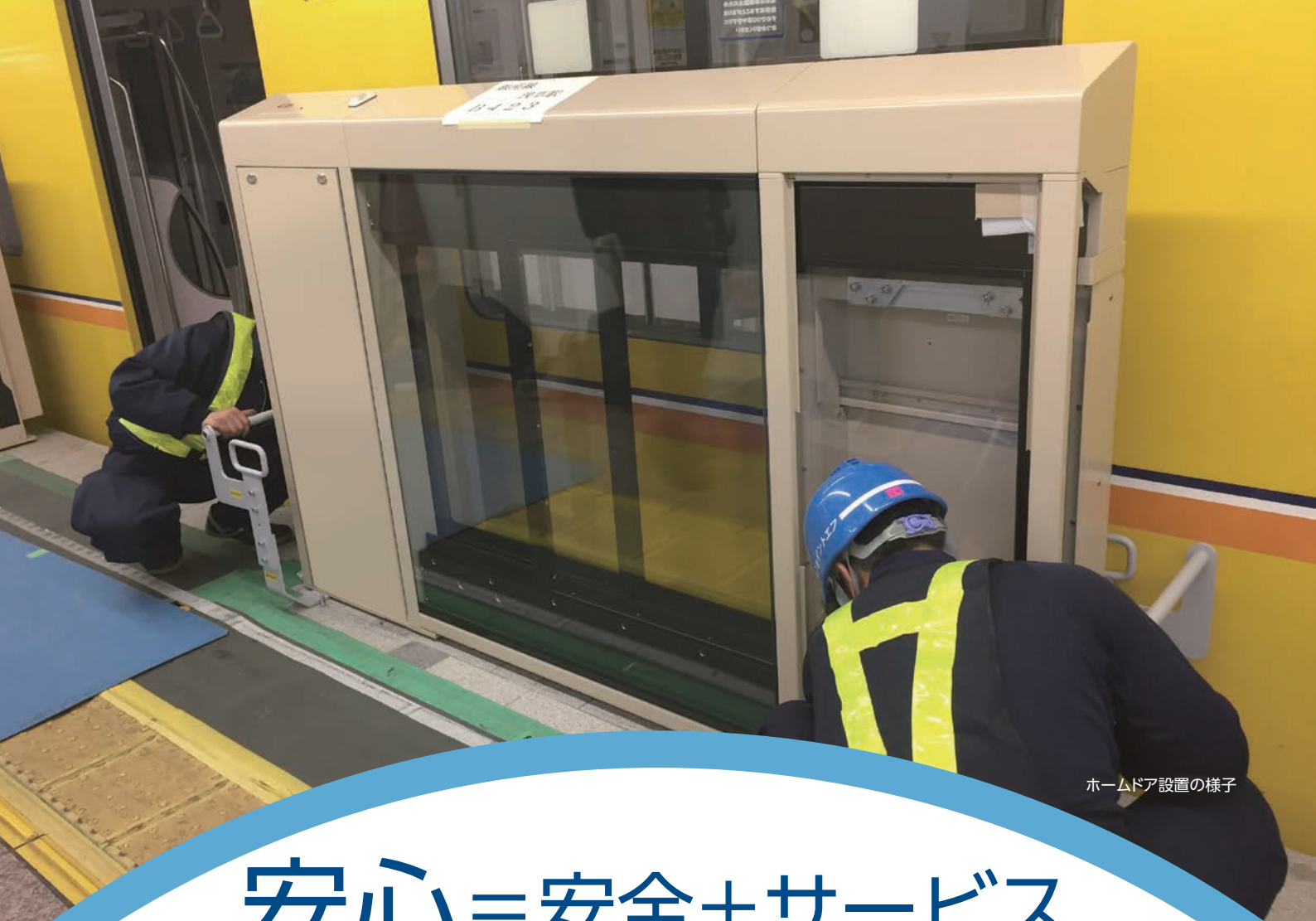
ホームドア設置の様子