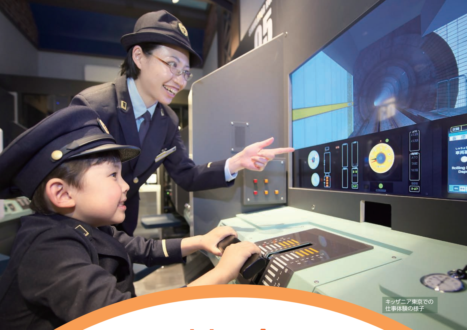
キッズニア東京での 仕事体験の様子