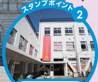
東京おもちゃ美術館