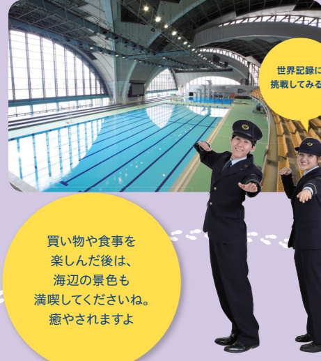
世界記録に挑戦してみる?

国内最大級の公認水泳施設。スイマーの聖地・メインプール、3歳以上から利用できるサブプール、本格的なダイビングプールは一般公開あり。 [開館時間] 平日・土曜 8:45~22:30、日・祝日 8:45~21:30 ※一般公開日はHPを参照 [休] 1/14・2/17・2/18・3/9・3/31、点検日(年2回) [住] 東京都江東区辰巳2-8-10 [電] 03-5569-5061 ※水泳場に来館してもプールサイド及び観客席での見学はできません。ご了承ください。