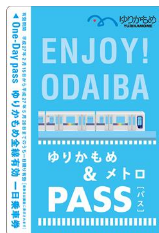
유리카모메 1 일승차권