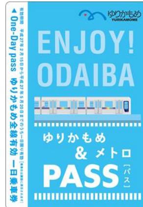
유리카모메 1 일승차권