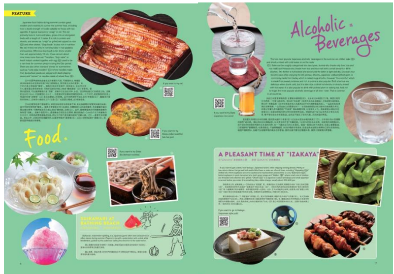
▲특집 페이지 이미지