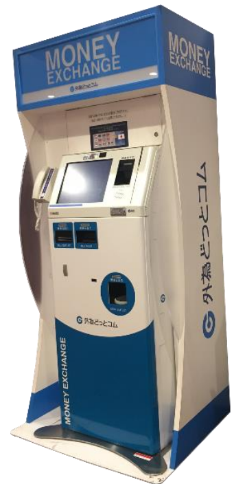
外币自动兑换机示意图