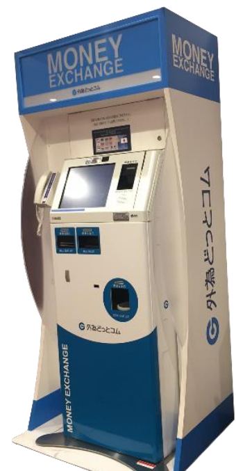
รูปแบบตู้แลกเปลี่ยนเงินตรา ต่างประเทศอัตโนมัติ