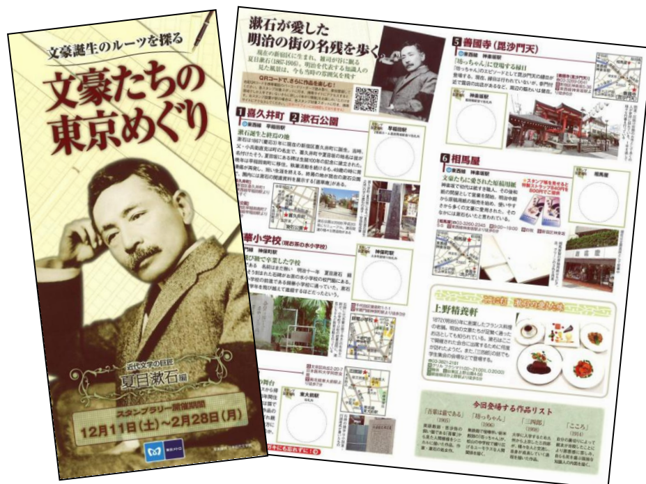
専用リーフレットイメージ