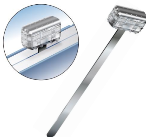
B 賞「東京メトロオリジナル ブックマーカー」 イメージ