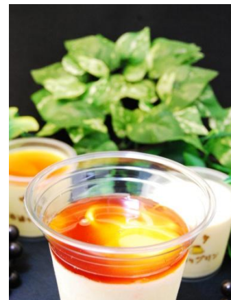
プリン de シェイク 価格：320円（税込）