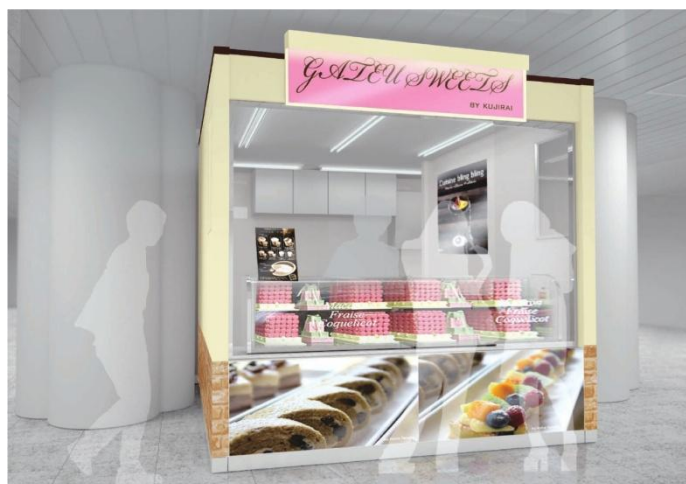
ショップイメージ