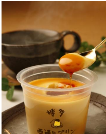
ポシェ 価格：270円（税込）