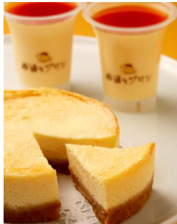
プリン de チーズ ポシェ 価格：1,365円（税込）