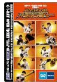
専用一日乗車券 大人用イメージ