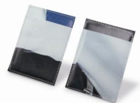
オリジナルリサイクルパスケース イメージ