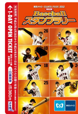
専用一日乗車券 小児用イメージ