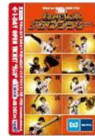
専用一日乗車券 小児用イメージ