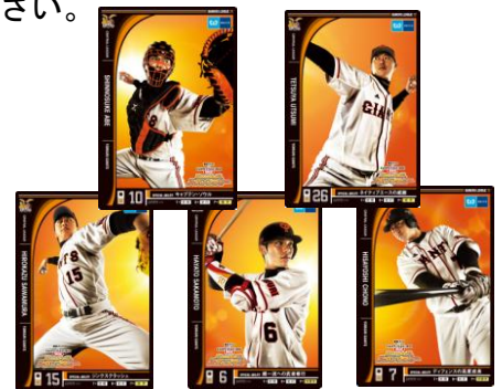
オリジナルオーナーズリーグカード イメージ

「上野」「銀座」「東京」「新宿」「池袋（有楽町線）」 「飯田橋」「錦糸町」「北千住（千代田線）」「茅場町」