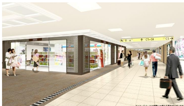
Echika fit 銀座 完成イメージ