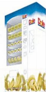
自動販売機対象商品「ポビーバナナ」