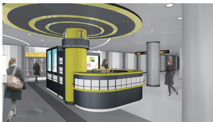
観光案内所 イメージ