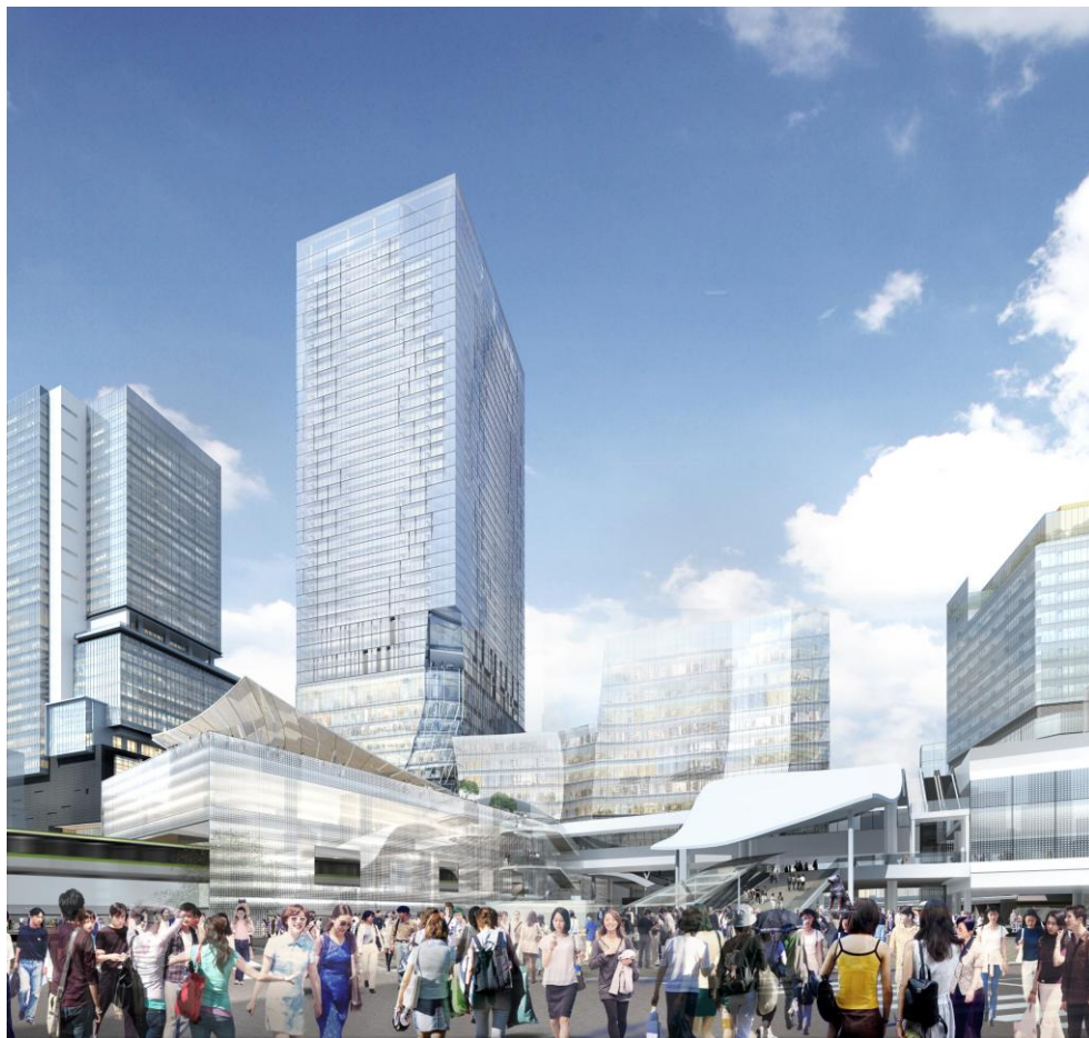
西口駅前広場前交差点（スクランブル交差点）より南東を望む