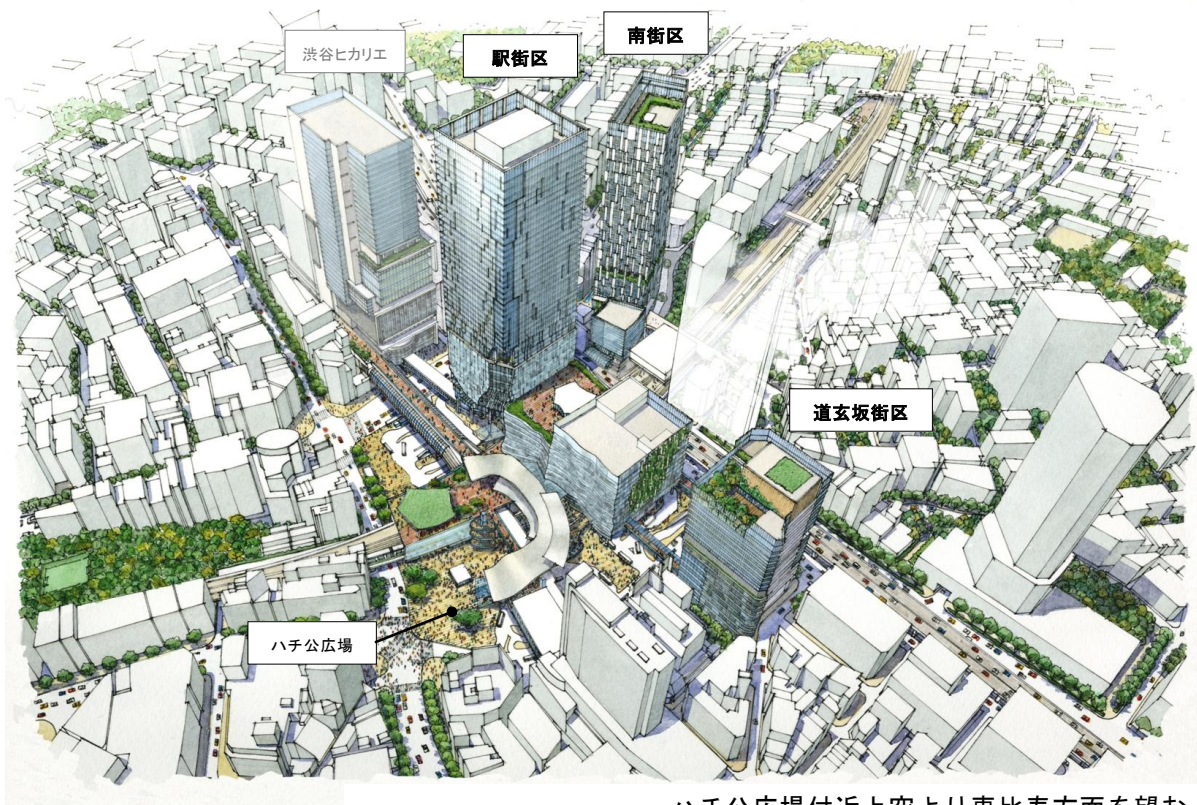
ハチ公広場付近上空より恵比寿方面を望む