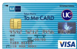
To Me CARD UC 一般カード