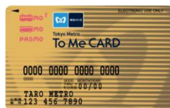
To Me CARD PASMO ゴールドカード