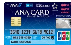
ANA To Me CARD PASMO JCB （愛称：ソラチカカード）

※券面画像はイメージです。 ※ゴールドカードは、UC・JCB・ニコスからご選択いただけます。 ※「PASMO」は株式会社パスモの登録商標です。