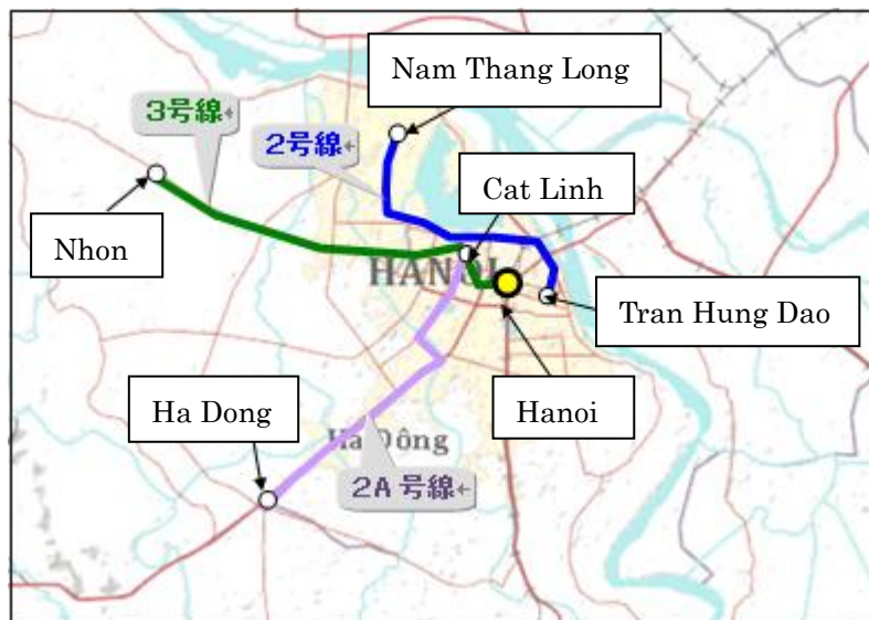
ハノイ都市鉄道建設事業(2号線・2A号線・3号線)の概要