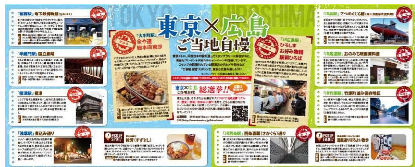
東京と広島のご当地自慢リスト