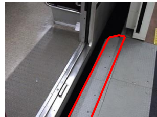
可動ステップ：赤枠部分がホームドアの開閉に連動してスライドし隙間を埋める。

さらに、曲線ホーム区間でホームと車両の隙間が大きい箇所がある駅には、当該箇所に可動ステップも取り付け、より一層の安全性向上に努めています。