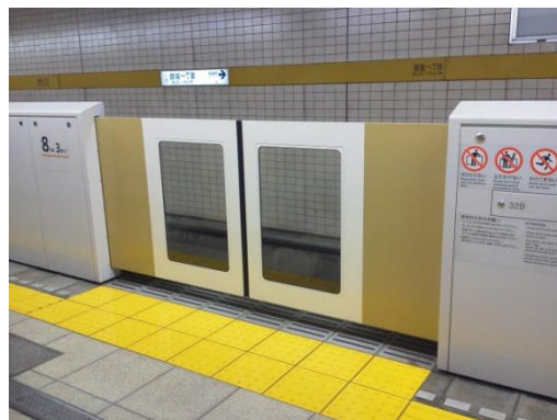
平成 24 年 4 月 14 日から使用開始された銀座一丁目駅のホームドア

工事期間中はお客様に大変ご不便とご迷惑をお掛けいたしますが、ご理解とご協力をお願いいたします。