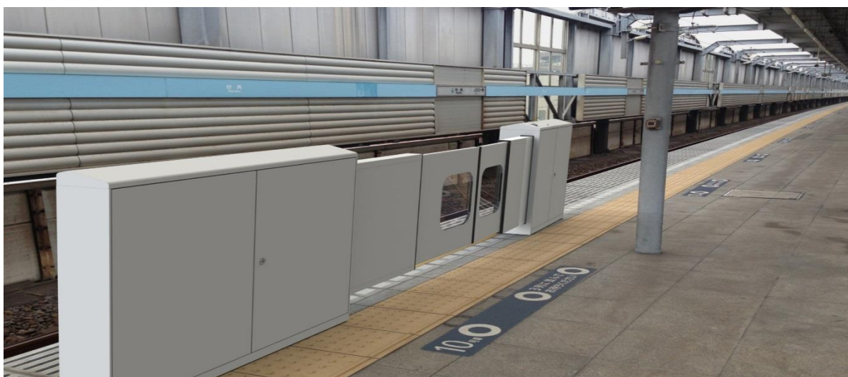
ホームドア設置イメージ