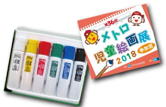
参加賞（オリジナル絵の具）

※このニュースリリースは、国土交通記者会、ときわクラブ、都庁記者クラブ、レジャー記者クラブにお配りしています。