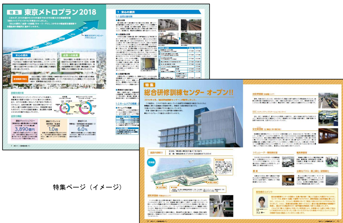
特集ページ (イメージ)

各編において主に2015年度に重点的に取り組んだ活動の内容や実績を記載したほか、特集では、今年度からスタートした3か年の中期経営計画「東京メトロプラン2018」及び2016年4月に開所した「総合研修訓練センター」を取り上げ、全てのお客様に東京メトロを「安心」してご利用いただくための施策や、「安心」の提供を支える「人」を育成する取組について紹介しています。