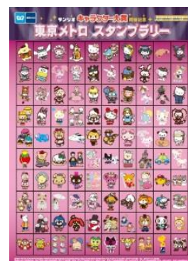
サンリオ 100 キャラクターシール