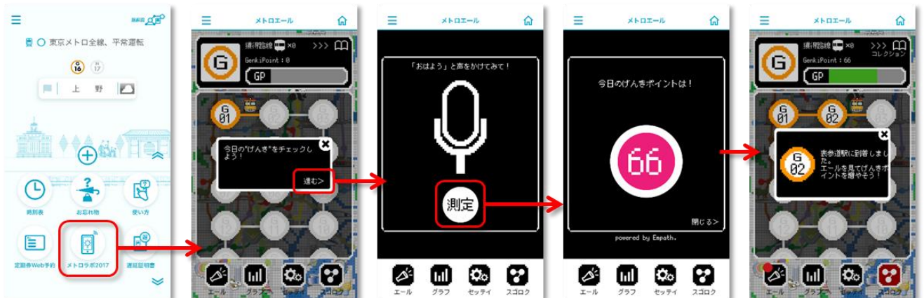
トップ画面からスゴロク実施までの流れ