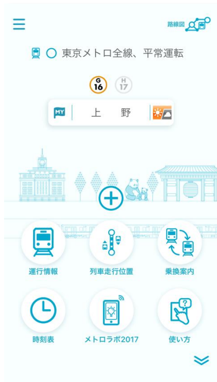
「アプリ TOP」画面イメージ