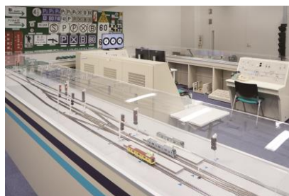
その他館内見学（信号教習室）