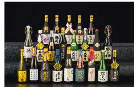
金賞を受賞した福島の日本酒

福島県の観光案内パンフレットを配布し、福島の温泉や、鶴ヶ城などの観光名所等の観光PRを実施します。