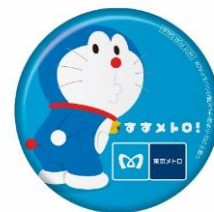
〈缶バッジイメージ〉