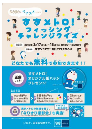
〈告知チラシイメージ〉

現在実施中の「すすメトロ！」検定から出題される三択クイズに、正解の色のボールを釣り上げて回答していただく「フィッシングチャレンジクイズ」を実施します。正解された方には、すすメトロ！オリジナルドラえもん缶バッジをプレゼント！無料で参加いただけるイベントですので、たくさんの方のご来場をお待ちしております。