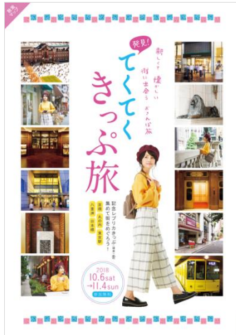
《散策マップ 表紙イメージ》

散策対象エリア内の10施設では、「発見！てくてくきっぷ旅」の遊び方やエリアの見どころ、グルメなどを紹介した『散策マップ』を配布します。