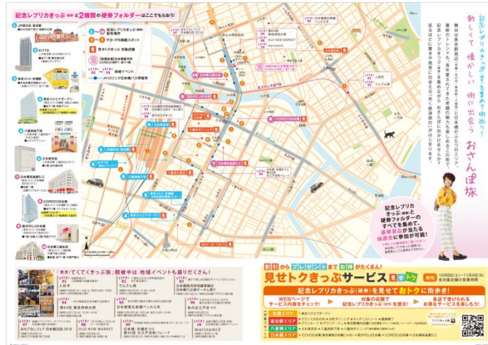
《散策対象エリア イメージ》