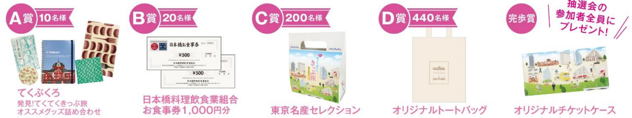
《抽選会賞品 イメージ》

散策対象エリア内の 10 施設全ての記念レプリカきっぷ(硬券)と硬券フォルダーを集めると、土・日・祝日に「日本橋案内所(COREDO 室町 1・地下 1 階)」で開催する『抽選会』にご参加いただけます。記念レプリカきっぷ(硬券)をコンプリートした方全員に、「完歩賞」としてオリジナルチケットケースをプレゼントするほか、抽選で合計 670 名様に「発見! てくぶくろ オススメグッズ詰め合わせ」や「お食事券」などの素敵な賞品が当たります。