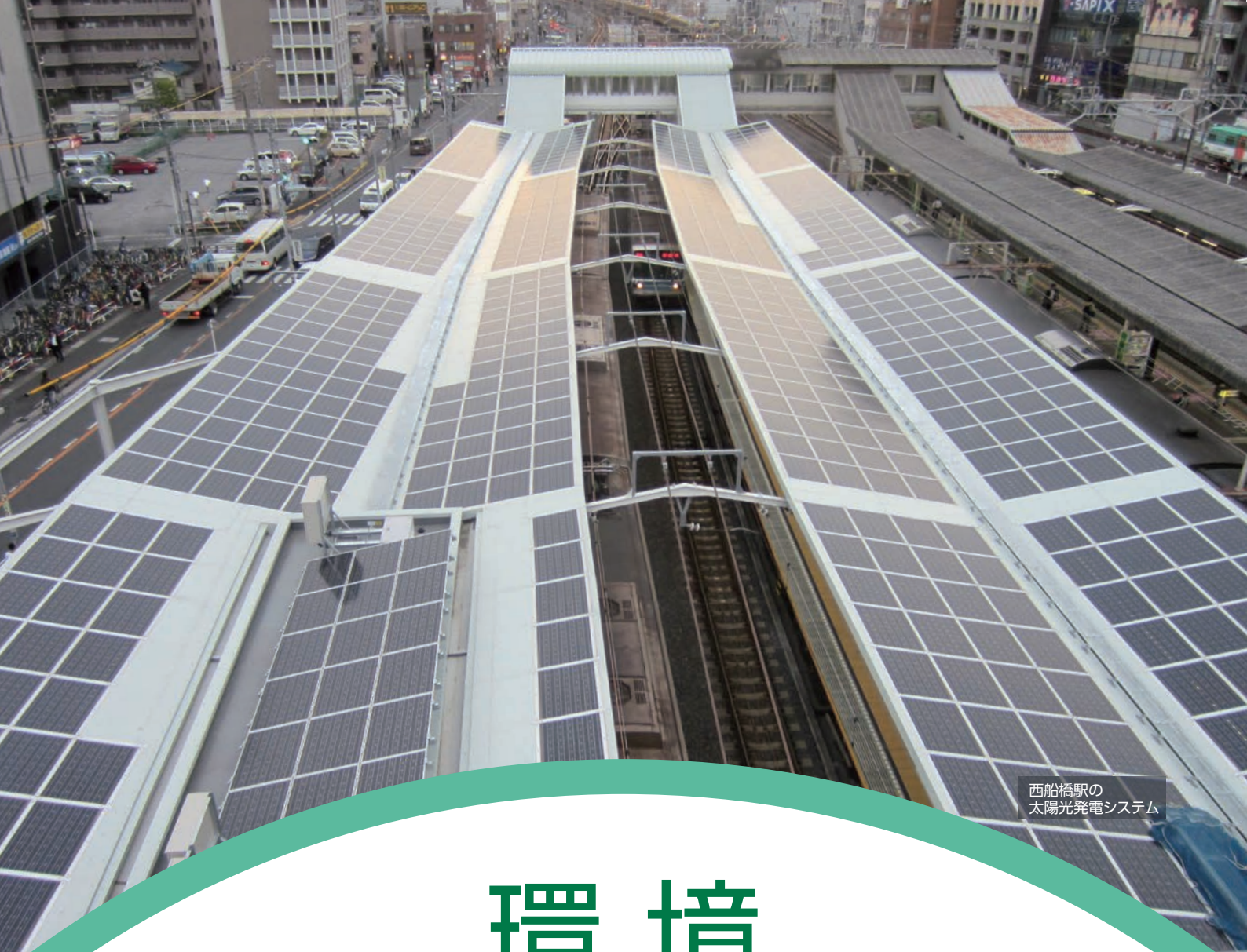
西船橋駅の 太陽光発電システム