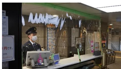
ビニールシート設置状況