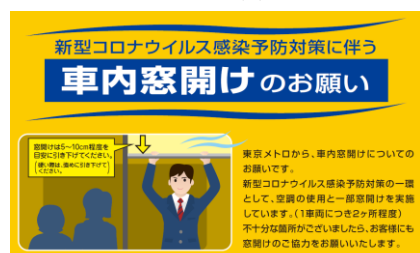
車内窓開けポスター