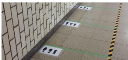
お並び位置明示状況（飯田橋駅）