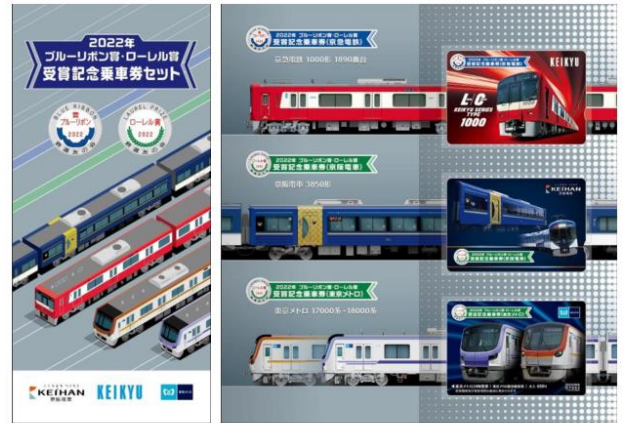
2022年ブルーリボン賞・ローレル賞受賞記念乗車券セット イメージ

https://www.tokyometro.jp/news/images_h/metroNews221124_g30.pdf