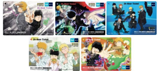
「モブサイコ100 Ⅲ」東京メトロオリジナル24時間券 イメージ

https://www.tokyometro.jp/news/images_h/metroNews221124_77.pdf