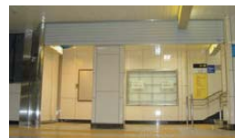
●二段落としシャッター