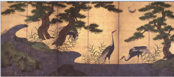
重要文化財 日月松鶴図屏風 室町時代・16世紀