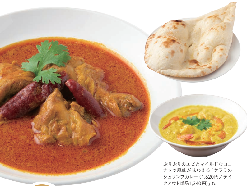
ぶりぶりのエビとマイルドなココナッツ風味が味わえる「ケララのシュリンプカレー（1,620円/テイクアウト単品1,340円）」も。