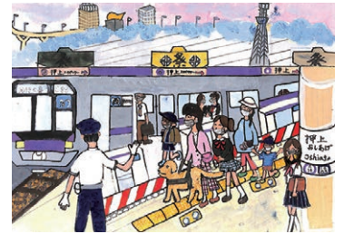
※昨年度の特選作品

小学生を対象にした「第39回メトロ児童絵画展」を開催します。地下鉄をモチーフに「安全マナー」などをテーマにした絵のほか、夢のある楽しい絵を募集中。入賞作品は、10月に東京メトロ駅構内で展示を予定しています。ぜひご参加ください！