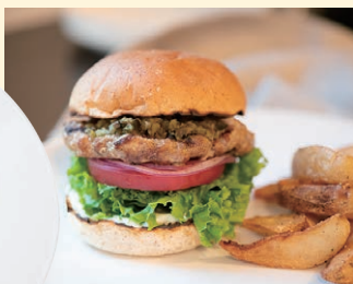
テイクアウトできる「自家製クラシックハンバーガー（ポテトフライ付き 1,320円）」もおすすめ！