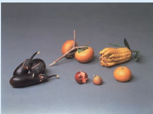
象象牙果菜置物 安藤緑山作 明治～昭和時代初期・20世紀

「自然のすがた」をテーマに、日本・東洋の美術品をご紹介します。四季が織りなす美しい情景を描いた絵画、自然のモチーフをデザインした茶道具など、新しい視点での“地球の魅力”を心で感じることができるはずです。