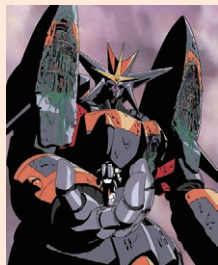
『トップをねらえ!』1988年発表