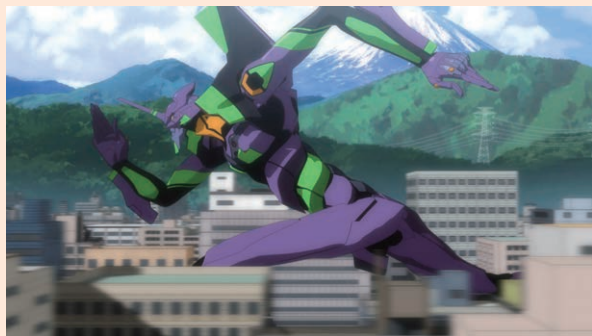
『エヴァンゲリオン新劇場版：破』2009年公開 ©カラー