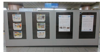
※写真は昨年度の展示風景

7月から9月までの期間に募集した「メトロ児童絵画展」への応募作品の中から、入賞作品(特選・入選・佳作・奨励賞)を展示します。お子さまたちのすてきな作品の数々をぜひこの機会にご覧ください。展示場所や期間などの詳細は駅乗り場またはメトロ文化財団のHPをご覧ください。