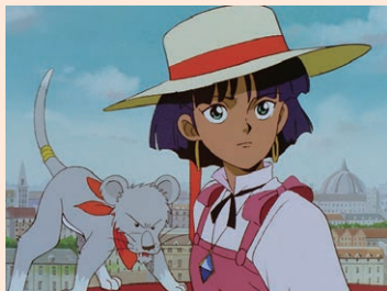
『ふしぎの海のナディア』1990年放送 ©NHK・NEP

『エヴァンゲリオン』シリーズで知られる、庵野秀明氏にフォーカスした世界初の企画展。アニメーター時代に参加した過去作品や、監督・プロデューサーとして活躍する最新の仕事など、その制作の原点を余すところなくご紹介します。