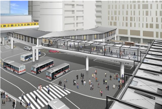
完成イメージ(渋谷クラス側から見る)