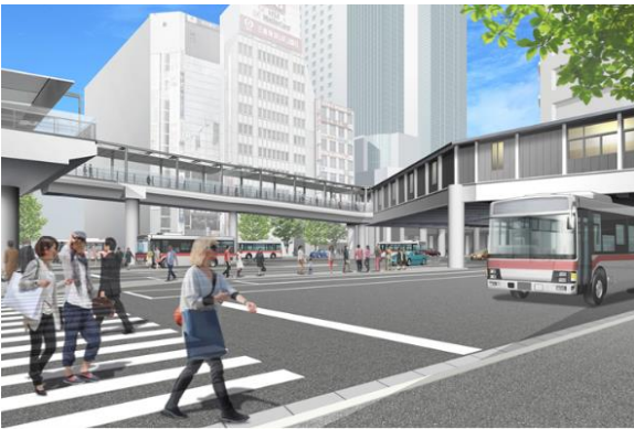
完成イメージ(JR渋谷駅側から見る)