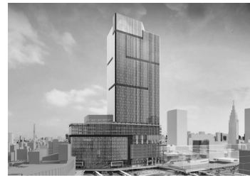
(新宿駅西口地区開発計画/建物イメージ)

不動産事業においては、収益性の向上を図るべく、駅周辺の都市開発と一体となった建物の整備や、神宮前六丁目用地再開発建物の竣工、東上野四丁目A-1地区再開発準備組合への事業協力者としての参画、新宿駅西口地区開発計画の新築工事に着手いたしました。また、不動産事業の成長を目的とした不動産アセットマネジメント事業への参入に向け、「東京メトロアセットマネジメント株式会社」設立の準備を進めました。