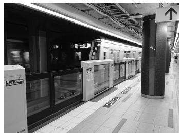
(ホームドアの整備事例)