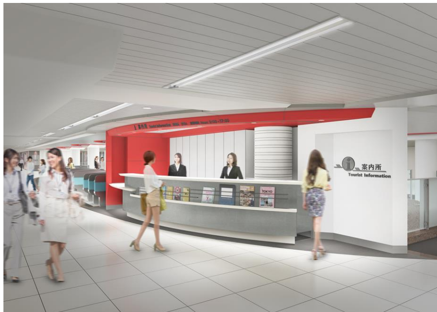
东京站旅客问讯处示意图