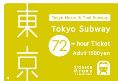
Billete 72 horas