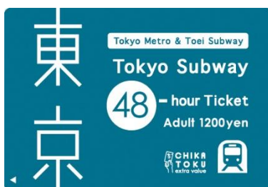
Billete 48 horas