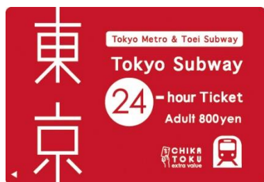
Billete 24 horas