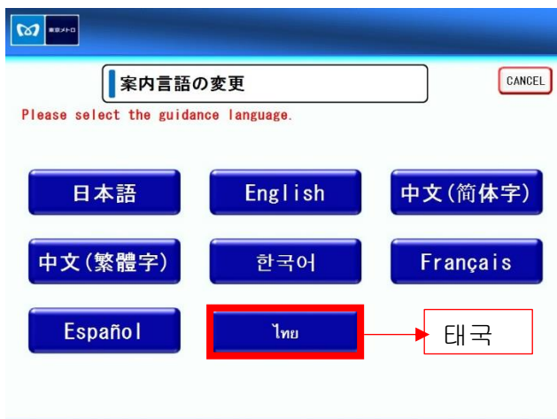
언어 선택 화면