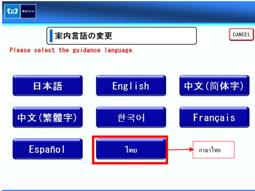
หน้าจอเลือกภาษา