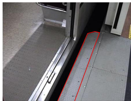
可動ステップ：赤枠部分がホームドアの開閉に連動してスライドし隙間を埋める。

さらに、曲線ホーム区間でホームと車両の隙間が大きい箇所には、可動ステップも取り付け、より一層の安全性向上に努めています。今回の使用開始区間では、江戸川橋駅の 13 か所に設置します。