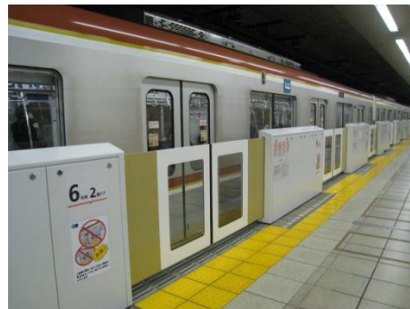
本年 1 月 22 日から使用開始された池袋駅のホームドア