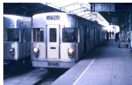
往年の日比谷線 3000 系車両