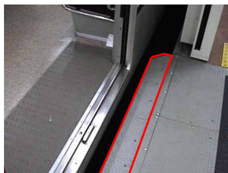
可動ステップ：赤枠部分がホームドアの開閉に連動してスライドし隙間を埋める。