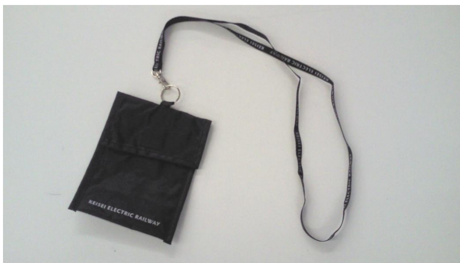
オリジナルネックストラップ&チケットホルダー