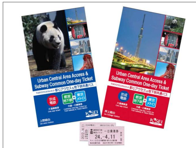
「TOKYOウエルカムセット・都心アクセス&地下鉄共通パス」 （右：押上経由、左：京成上野経由）

「TOKYOウエルカムセット・都心アクセス&地下鉄共通パス」の発売概要につきましては、別紙のとおりです。