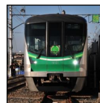
平成 23 年にローレル賞を受賞した 16000 系