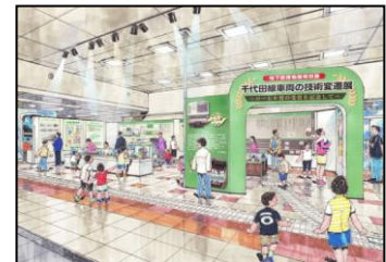
展示会場イメージ