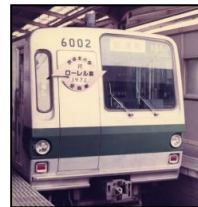
昭和 47 年にローレル賞を受賞した 6000 系

※ ローレル賞は「鉄道友の会」（全国規模の鉄道愛好者団体）が毎年営業運転に就いた車両の中から、性能、デザイン、製造企画等のなどの諸点に最も卓越したものと認められた車両に対して贈るもので、昭和 36 年に制定されました。