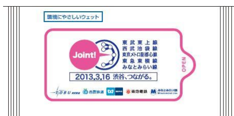
オリジナルウェットティッシュ

相互直通運転開始をPRするノベルティ（オリジナルウェットティッシュ）やチラシを配布します。