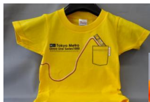
フロントデザイン（イエロー）

車両をモチーフにしたもの、路線のカラー9色をイメージしたもの、東京メトロの人気キャラクター「メトポン」をモチーフにした『東京メトロオリジナルネクタイ』（全 5 種類）【写真下】と、話題の新型車両銀座線 1000 系をモチーフにし、胸のポケットからは 1000 系がかわいく顔をのぞかせている『東京メトロオリジナルちびっこ T シャツ』（全 2 色、サイズ：100、110、120、130）【写真右】が新しく登場です。