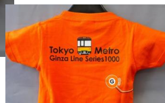
バックデザイン（オレンジ）