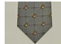
メトポンシルバー