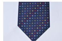
路線カラーリング